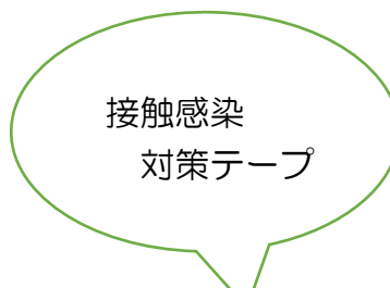
接触感染 対策テープ