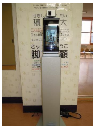
顔認証型 非接触型 体温計